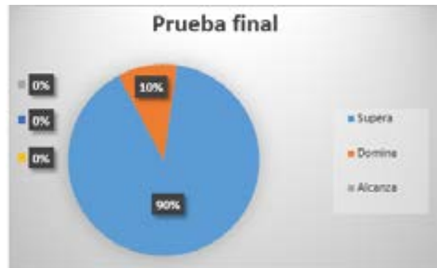
Gráfico 2: Prueba final

En cuanto a la prueba final, esta fue aplicada a 10 de los 29 estudiantes que fueron seleccionados para la experiencia pedagógica. La prueba contiene las mismas destrezas de la prueba inicial, con tres preguntas con un valor total de 10 puntos, se otorgó quince minutos para completar la misma. Se presentan los resultados de los estudiantes categorizados en rangos de: supera, domina, alcanza, próximo alcanzar y no alcanza.