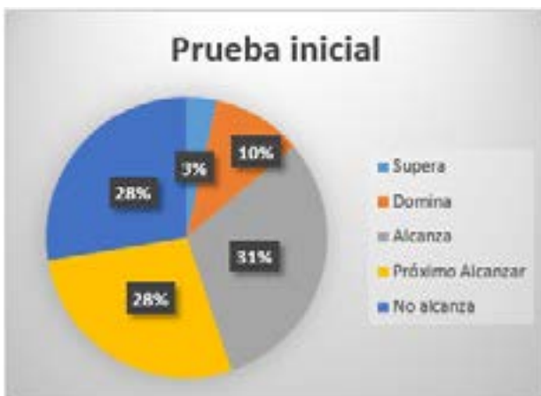
Gráfico 1: Prueba inicial o de diagnóstico

Luego de tabular los datos, se evidenció que los rangos que más sobresalen son los de: próximo alcanzar y no alcanza, que representan el 56%. A partir de ello se puede afirmar que existe deficiencia en el desarrollo de las destrezas de lectura, escritura y comprensión lectora, recalcando que son destrezas que ya deberían estar desarrolladas o encaminadas a ello.