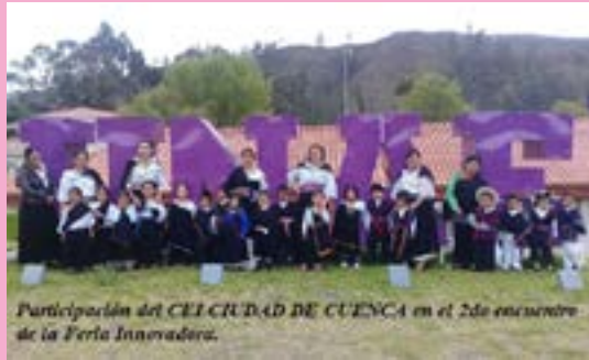
Participación del CEECIUDAD DE CUENCA en el 2do encuentro de la Feria Innovadora.