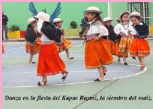
Danza en la fiesta del Kapac Raymi, la siembra del maíz.