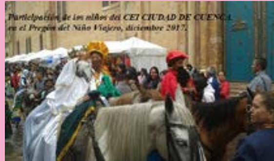
Participación de los niños del CEE CIUDAD DE CUENCA en el Pregón del Niño Viejero, diciembre 2017.