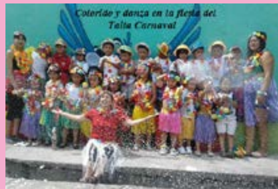
Colorido y danza en la fiesta del Taita Carnaval