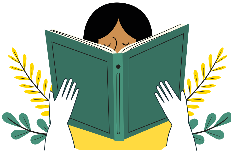
Imagen de Freepik